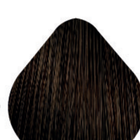
6,13 Louro Escuro Acinzentado Dourado