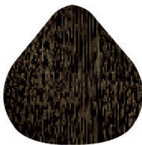
CC 7 Louro