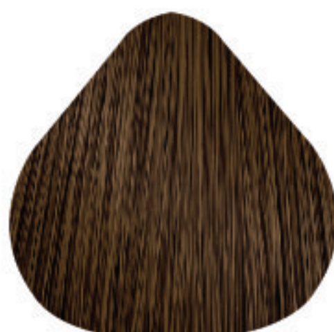
7,3 Louro Dourado