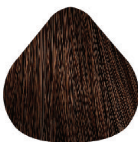
6,34 Louro Escuro Dourado Acobreado