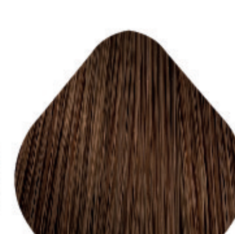
7,23 Louro Irisado Dourado