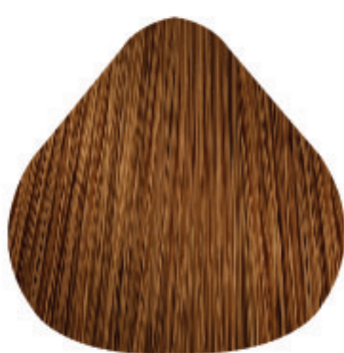
8,34 Louro Claro Dourado Acobreado