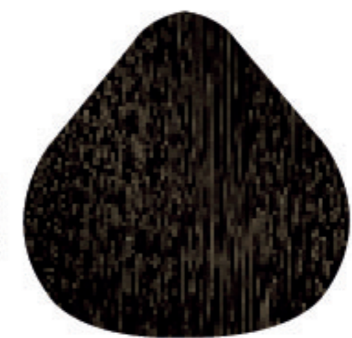
CC 5 Castanho Claro