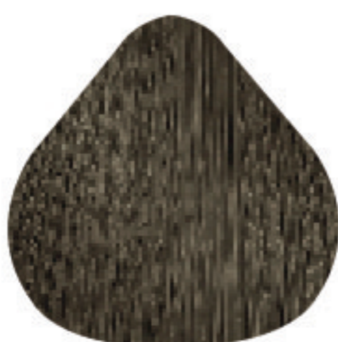
CC 8,1 Louro Claro Acinzentado