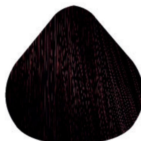
4,56 Castanho Acaju Vermelho