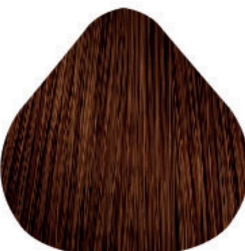
7,35 Louro Dourado Acaju