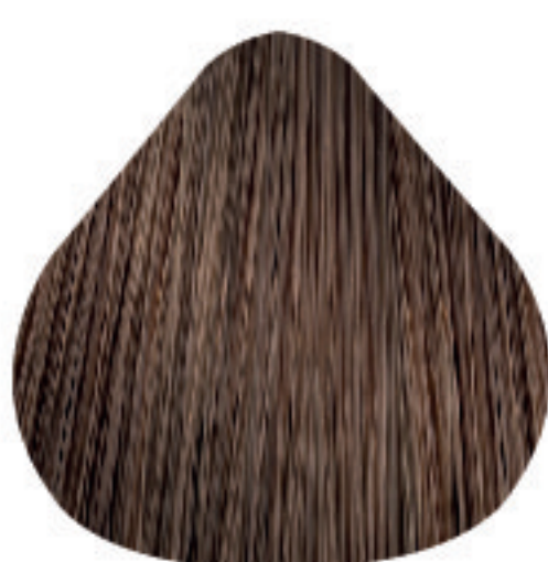
8,12 Louro Claro Irisado Cinza