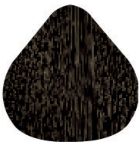
CC 6 Louro Escuro