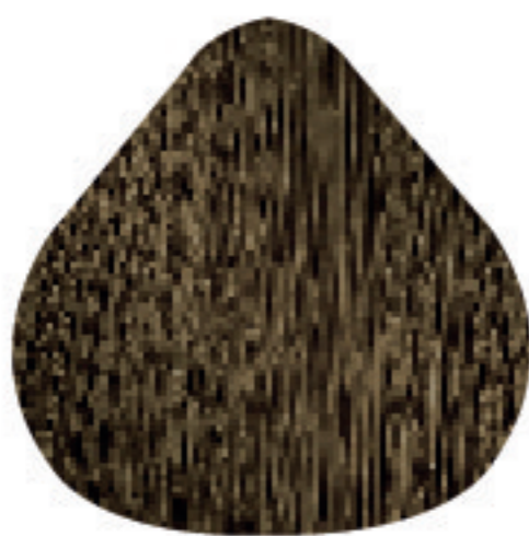
CC 8 Louro Claro