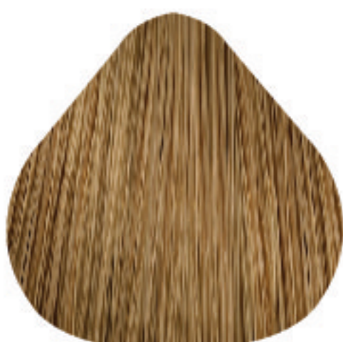
9,3 Louro Muito Claro Dourado