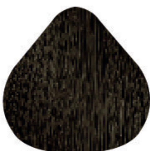
CC 6,1 Louro Escuro Acinzentado