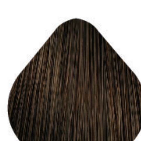
7,13 Louro Acinzentado Dourado