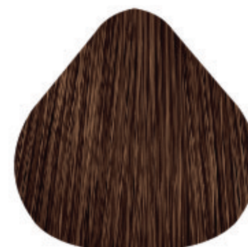
6,41 Louro Escuro Acobreado Acinzentado