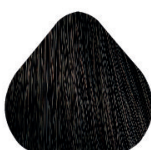
6,07 Louro Escuro Natural Frio