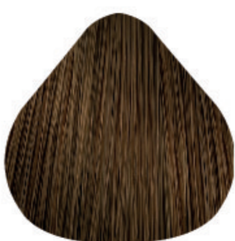
7,31 Louro Dourado Acinzentado