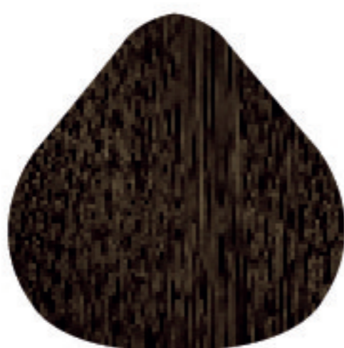
CC 7,8 Louro Marrom Natural Luminoso