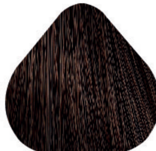
6,32 Louro Escuro Dourado Irisado