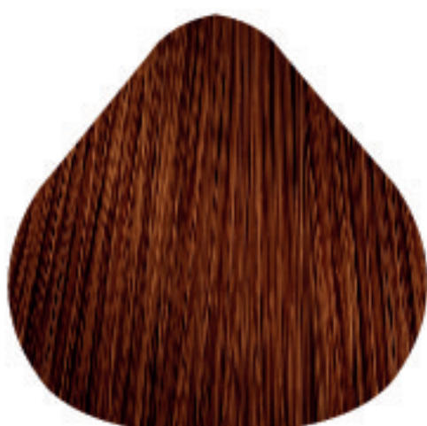
7,4 Louro Acobreado