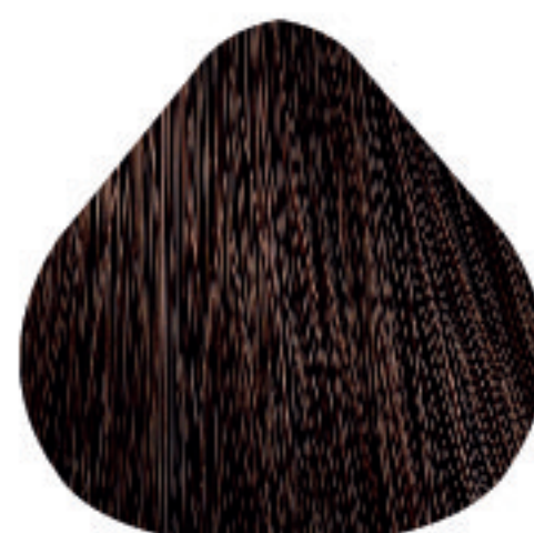
6,3 Louro Escuro Dourado