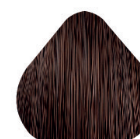
7,8 Louro Marrom Natural Luminoso