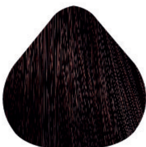
5,5 Castanho Claro Acaju