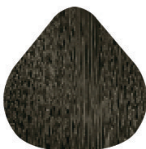
CC 7,1 Louro Acinzentado