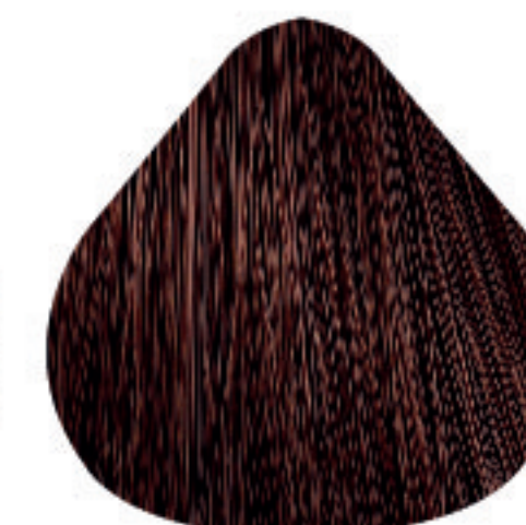
6,45 Louro Escuro Acobreado Acaju